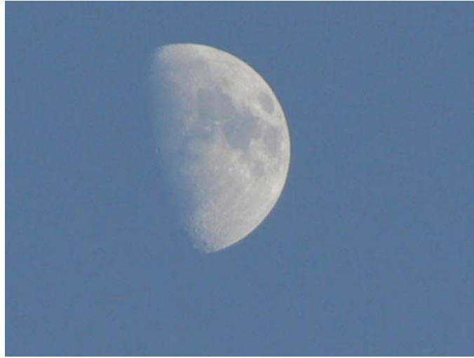
Vali konağı kamp yerinden

Araç yolununun bittiği yere kadar oldukça rahatsız bir yolculuktan sonra saat 15:20 gibi yürüyüşe başladık. Traktör için kişi başı 10 YTL verdik (toplam, 50 YTL). Tempolu ve iyi bir yürüyüş ile saat 16:00 gibi Akşam Pınarı'na, saat 17:15'de de geceyi geçireceğimiz Valikonağı kamp yerine (2600 m) ulaştık. Çadırlarımızı kurup yemeğimizi yedik. Bu kamp yerinde çok olmasa da su var.