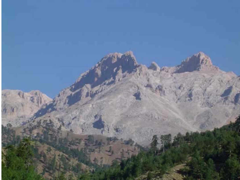
Açıman yayla önünden Aladağlar

Saat 06:30'da uyanıp çadırlarımızı topladık. Saat 08:00'de yaylacı Ali'nin arabası ile Aladağ'a gitmek için yola çıktık. Saat 10:00 gibi Aladağ ilçesine ulaşmıştık. Ali, istersek kişi başı 4 ytl karşılığı bizi İmamoğlu'ya kadar götürebileceğini söyledi. Gitmeye karar verdik. Aladağ'dan İmamoğlu 60 km, Adana ise 100 km uzaklıkta.