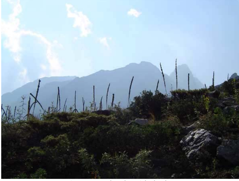
Acıman yolundan Aladağlar

Patika yolu boyunca ilerliyoruz. Yol üzerinde su var. Adana ve Kayseri tarafından gelen yaylacılarla karşılaşmaya başladık.