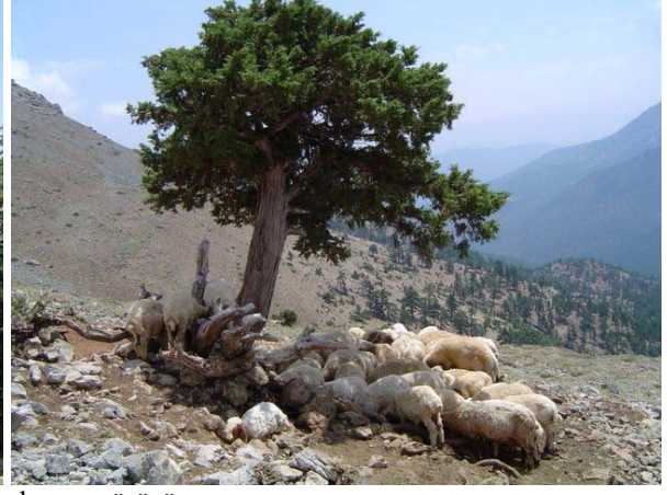
Sedir ağacı ve koyun sürüsü

Sabah bizi köyden getiren arabanın saat 19:00 gibi almasını tembihlemiştik. Planladığımızdan da erken bitirdik yürüyüşü. Sabah kahvaltı yaptığımız yerde ateş çayı demleyerek içiyoruz, yorgunluğumuzu biraz alıp götürüyor. Minübüsü beklerken vakit geçirmek için bir süre kulübede biraz da civardaki yaylacıların yanına çıkarak zaman geçirdik.