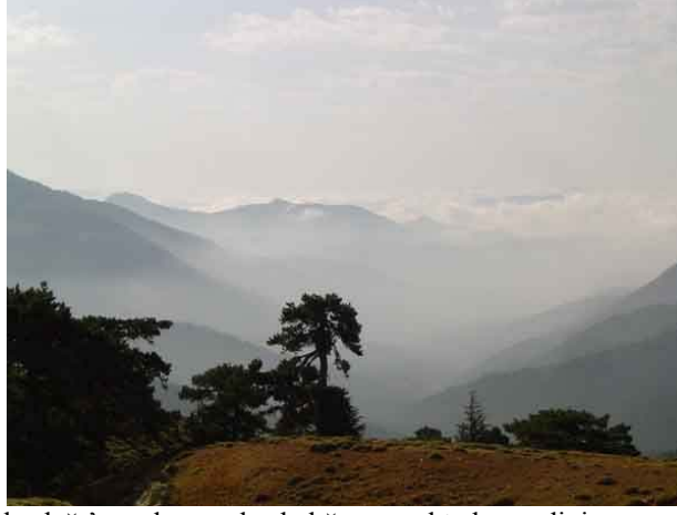
Bakırdağı'na çıkmaya başladığımız noktadan vadinin görünüşü