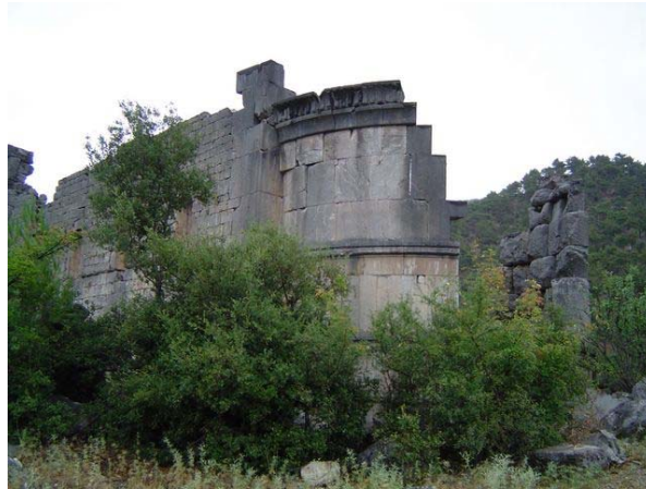
Feke kalesinin yakınındaki antik kent (Karakilise)