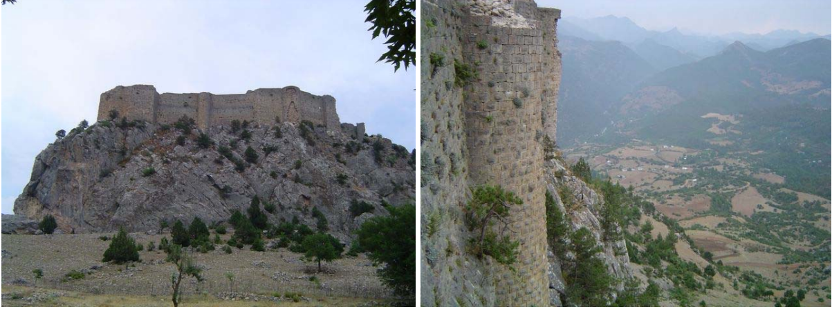
Feke kalesi ve kaleden eski Feke ve Göksu

Günü Feke'de geçireceğiz. Feke yakınında henüz keşfetmediğimiz yerler var. Bunlardan biri de Feke yakınında bulunan Feke kalesini, bugün bu kaleyi gezeceğiz. Kale, Saimbeyli-Tufanbeyli yolu üzerinde, eski Feke yerleşiminin bulunduğu mevkiide. Göksu'nun aktığı bu vadiden geçen yol da Feke-Gürümze yolu gibi ürkütücü. Yağmurdan olacak vadinin tabanından akan Göksu çamur renginde.