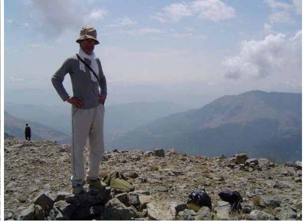
Zirveden Balık Gölü civarı

Yemek yemek için su kaynağı arayarak inişimizi sürdürdük. Ancak var olan su kaynakları da yazın sıcaklığından kurumaya yüz tutmuş. Su bulmayı umarak dağın yamacında, koyun sürüsü barındırmak için yapılmış ağılın olduğu yere ulaşıyoruz. Burada da su neredeyse yok gibi, olan su da içilecek gibi değil. Yemek için daha aşağılara gitmeye karar veriyoruz. Sedir ormanlarının başladığı orman sınırında, su olmasa da gölgede mola vererek yemeklerimizi kuru kuru yedik. Sedir ağaçlarının arasından inişimizi sürdürüyoruz. Balık Gölü'ne varırken hafif bir yağmur başladı. Artıp-azalan dozlarda yağın yağmurdan korunmak için bulduğumuz ağaç altlarına sığınıyoruz. Saat 14:00 gibi Balık Gölü'ne vardık. Yağmur şiddetlendi buraya gelen piknikcilerin çadırlarının altına girerek yağmuru dinlenmesini bekliyoruz. Yağmur diner gibi olunca da sabah kahvaltı yaptığımız Mesut'un dayısının kulübesinin bulunduğu yere kadar yürüdük.