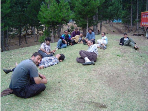
Uzun yürüyüşün ardından yaylada yaylacılarla

Sabah bizi köyden getiren arabanın saat 19:00 gibi almasını tembihlemiştik. Planladığımızdan da erken bitirdik yürüyüşü. Sabah kahvaltı yaptığımız yerde ateş çayı demleyerek içiyoruz, yorgunluğumuzu biraz alıp götürüyor. Minübüsü beklerken vakit geçirmek için bir süre kulübede biraz da civardaki yaylacıların yanına çıkarak zaman geçirdik.